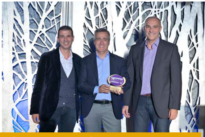
Platinum - Consumer Goods Display & Promo - Sales Promotion Center