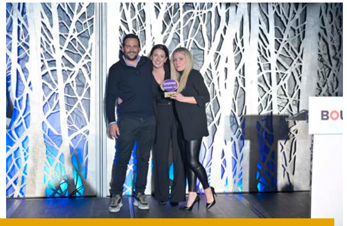
Platinum - Marketing-Ready Commercial Spaces - insurancemarket.gr