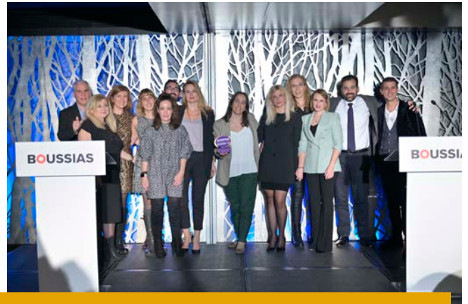
Agency of the Year - Sales Promotion Center